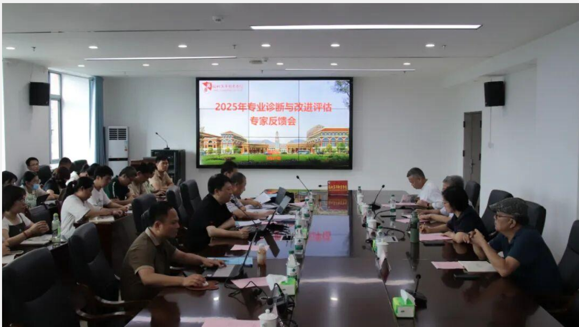
图 7-2 专业诊断与改进评估专家反馈会