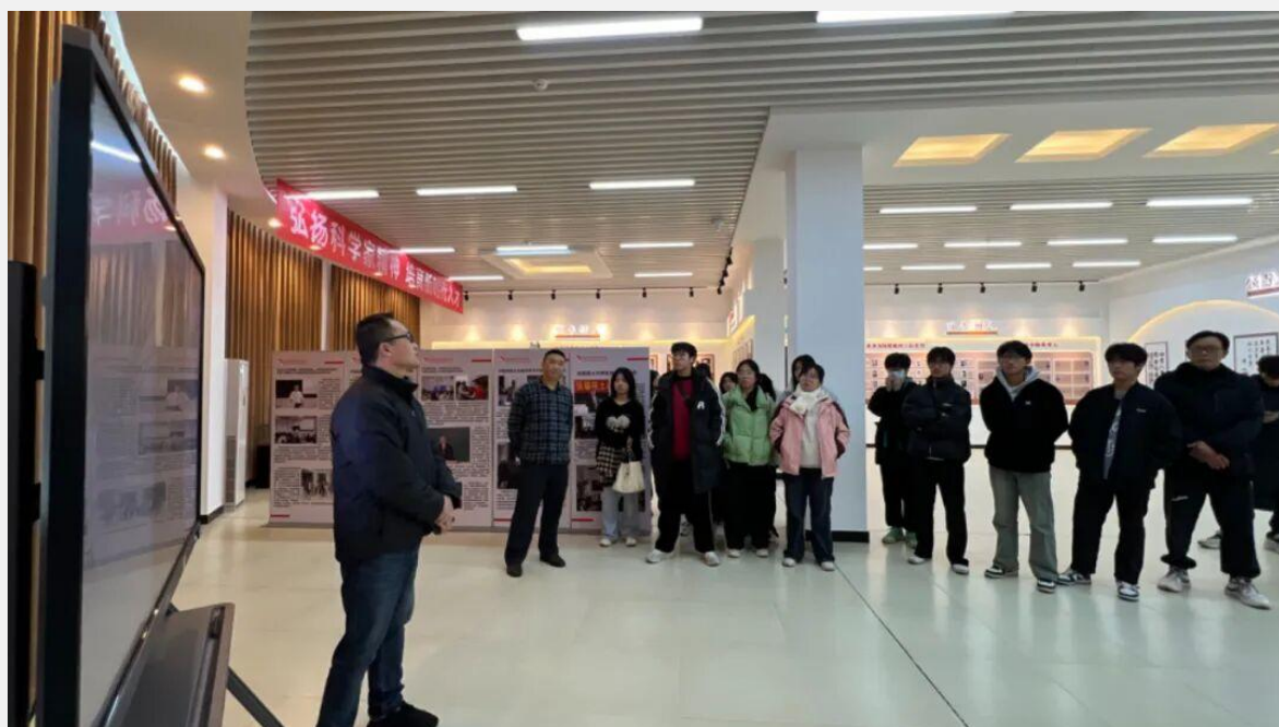
图 4-1 闽侯八中代表团参观学校科学家精神教育基地