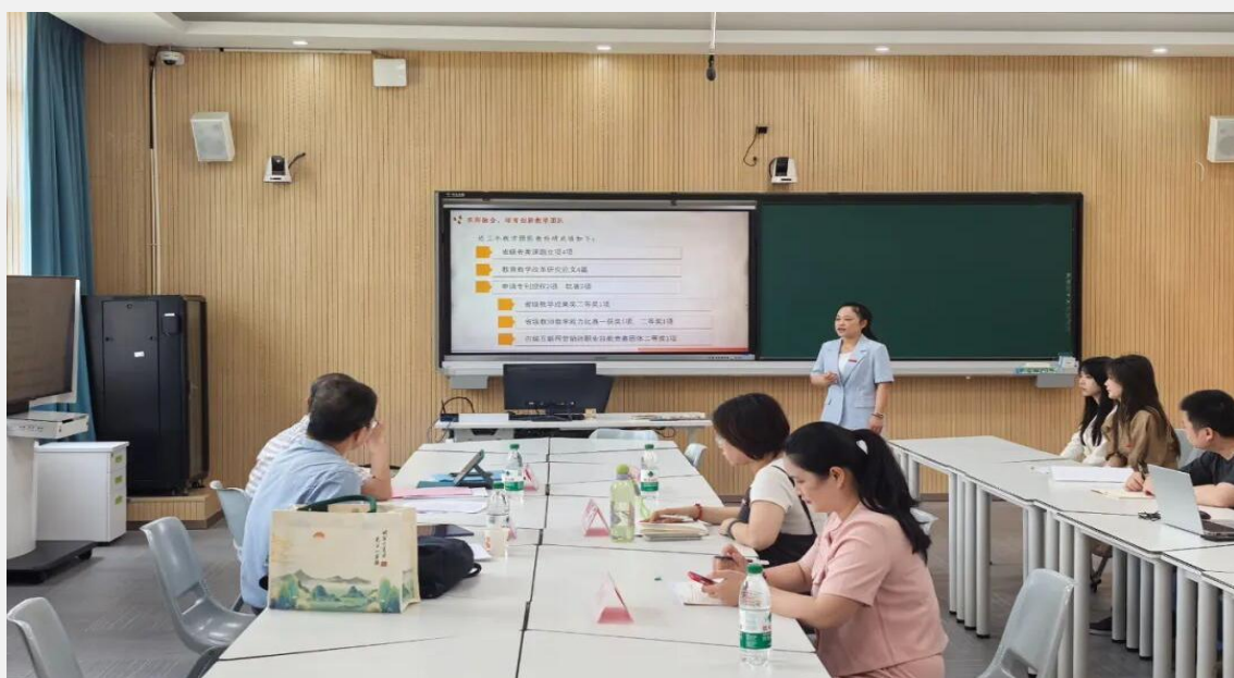
图 7-1 专业诊断与改进评估现场

为全面掌握专业建设情况，提升学校专业建设水平和人才培养质量，学校邀请省内兄弟院校 6 位专家组成专家评审组，对建筑室内设计、建设工程管理、电子商务三个专业开展校内专业诊断与改进评估工作。专家评审组依照本次专业诊断与改进评估的要求和流程展开工作，详细查阅专业人才培养方案、专业诊改自评报告及支撑材料、认真听取各专业带头人的汇报、深入教室听课、仔细查验自评报告相关原始档案材料、抽查审阅教学档案和课程考核档案、组织召开师生代表座谈会、实地考察各专业校内实训基地等。专家评审组充分肯定了各专业建设成效，同时指出了存在的问题与薄弱环节，并对标职业教育新要求、服务国家发展战略与区域行业发展的角度，就专业发展方向、实施路径、改进举措等提出了具有建设性的意见和建议。此次校内专业诊断与改进评估工作的顺利开展，是对学校专业建设的一次全面“体检”，也为学校进一步加强专业建设指明了方向，推动专业建设取得新突破、迈上新台阶。