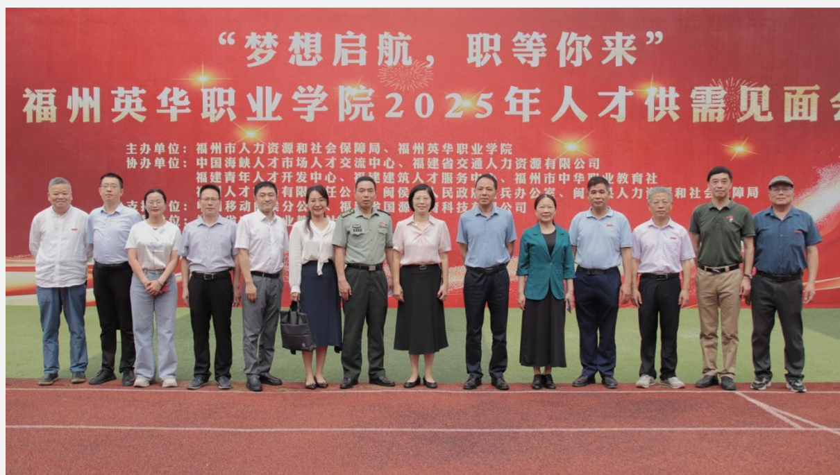
图 2-4 “梦想启航，职等你来” 2025 年人才供需见面会

一是搭建“线上+线下”招聘平台。统筹开展各类招聘会 40 场，吸引近 438 家优质用人单位参会，累计为 2025 届毕业生释放超 9000 个就业岗位，持续拓宽就业资源渠道。二是共建“就业驿站”。深化与福州人社部门合作，打造就业驿站，整合政策咨询、岗位匹配、求职指导等多元服务，全方位提升就业服务精准度与实效性。三是打造“就业文化节”特色品牌。以“职业生涯规划大赛”“创新创业大赛”“就业指导讲座”等活动为载体，强化择业观引导与就业能力培养，帮助学生明确职业方向、树立科学就业理念。四是深化“校企协同合作机制”。成功举办第五届校企合作论坛，搭建学院与企业深度对接桥梁，进一步增进双方互信，拓展人才培养、岗位输送等多元合作领域，实现校企共赢发展。