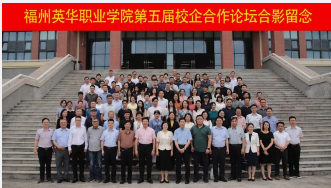
图 6-1 福州英华职业学院第五届校企合作论坛合影留念