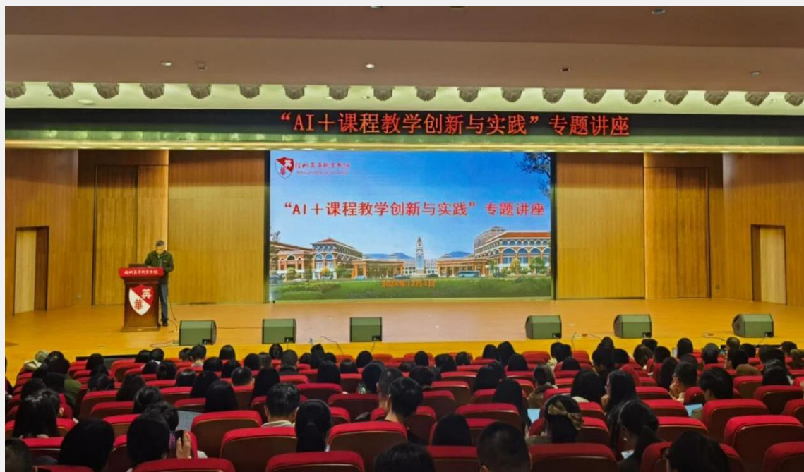
图 2-2 “AI+课程教学创新与实践” 专题讲座现场

更是提升教学质量、培养学生核心素养的关键举措。讲座极大地激发了教师参与数智化教育转型的热情和积极性，积极探索创新教学方法和模式，持续推动学校教育数字化建设进程。